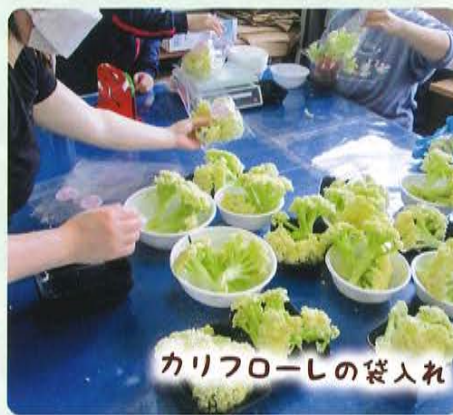
カリフローシの袋入れ