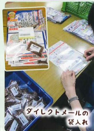
ダイレクトメールの 袋入れ