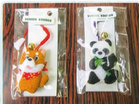
根付は利用者さんが一つ一つ 作った製品になります。 1個 350円です。