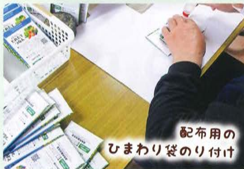
配布用の ひまわり袋のり付け