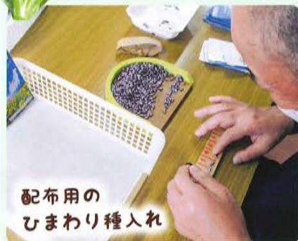
配布用の ひまわり種入れ