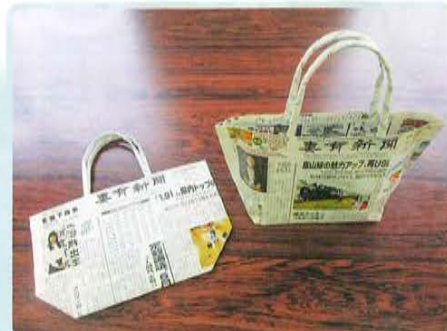
エコバックは妻有新聞さんから 寄付していただいたもので作成 しています。 1枚 100円で販売しております。