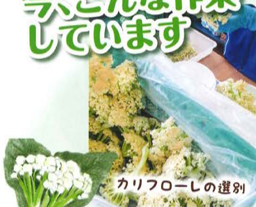
カリフローシの選別