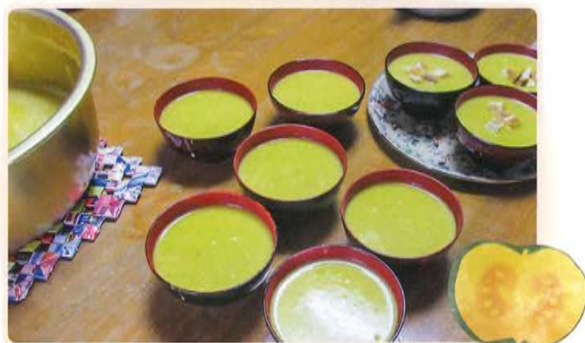
10月に食推ボランティアさんより昼食時に パンプキンスープを作ってくださいました。 とても美味しく、ありがとうございました。