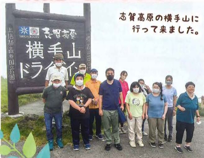
志賀高原の横手山に 行って来ました。